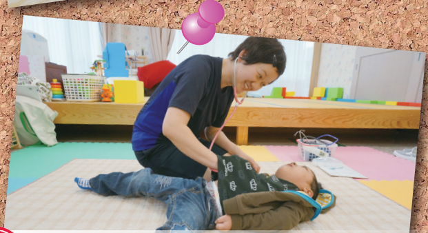
point 3 看護師による健康チェック・相談