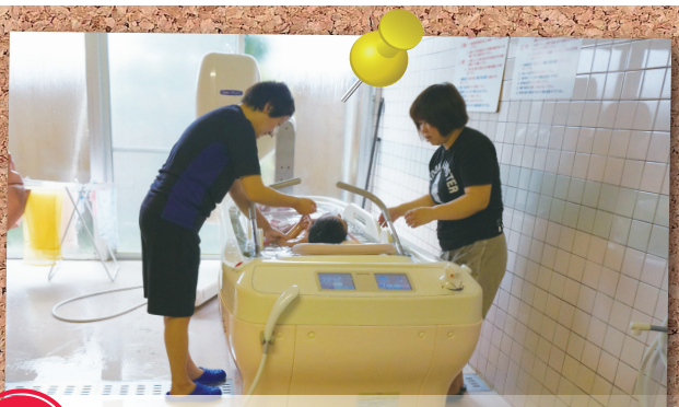
point 2 安心して快適な入浴