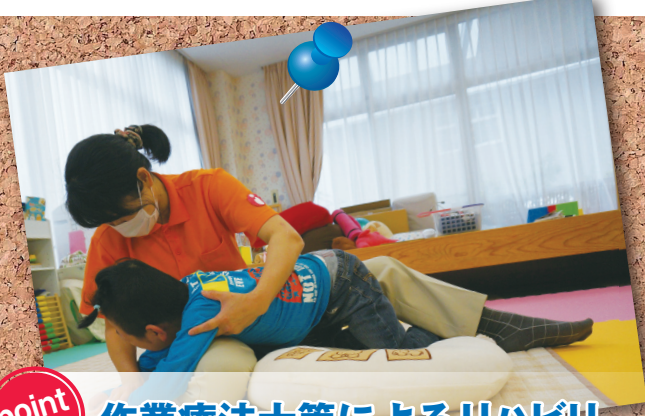
point 1 作業療法士等によるリハビリ