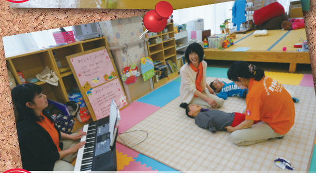
point 4 保育士による集団療育・相談